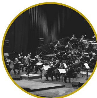
PREMIO CORPORACIÓN PATRIMONIO CULTURAL DE CHILE 2020 CATEGORÍA INSTITUCIÓN CULTURAL