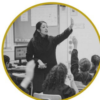
PREMIO CORPORACIÓN PATRIMONIO CULTURAL DE CHILE 2020 CATEGORÍA EDUCACIÓN