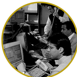
PREMIO CORPORACIÓN PATRIMONIO CULTURAL DE CHILE 2020 CATEGORÍA EMPRESA